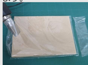
シーラー機にてフィルム 開口部をシール、 密封包装にてシュリンク

S-5Lを使用可能な容器サイズは目安として、おおよそ 外周440~490mm×400mm程度となります。(容器の形状により異なります)