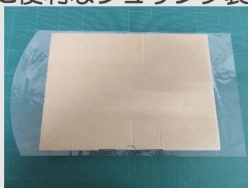
ゆうパケット、ネコポス などで使用するA4サイズ箱 (箱サイズ225×310×25)