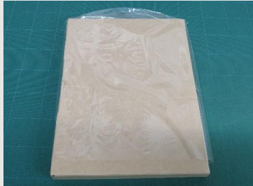
シール機が無い場合は 少し短いS-5 (0.02×260×330)使用