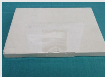
こんな感じの 仕上がりです

S-5Lを使用可能な容器サイズは目安として、おおよそ 外周440~490mm×400mm程度となります。(容器の形状により異なります)