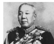
大山 巖(オオヤマ イワオ)

「大山 巖(おおやま いわお)」をご存じですか？ 薩摩藩士、明治の混乱を経て元帥陸軍大将となった人物です。 西郷隆盛の従兄弟としても知られています。 この大山巖氏は那須塩原市の開拓に大きくかかわっており、その時の邸宅が現在も残っています。明治38年頃建築、築118年です。