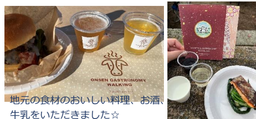
地元の食材の美味しい料理、お酒、牛乳をいただきました☆