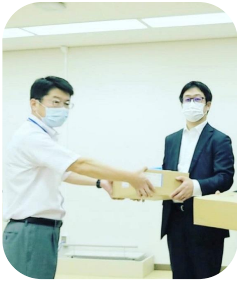
国立国際医療研究センターへ寄贈式

今年の夏は短かったですが非常に暑かったですね。栃木は一気に秋が深まってきましたが、秋から冬にかけて自然災害と新型コロナウイルス・インフルエンザ蔓延が非常に危惧されます。日頃の健康管理がなによりです。どうぞお体ご自愛くださいませ。コロナ禍で弊社が出来ることは何か。まずなによりに、お客様が必要とされているフィルムを一生懸命に生産しお届けすることです。現在、変則シフトで稼働日数を増やし対応しておりますが、一部商品はご注文の増加によって納品までお時間をいただいております。ここにお詫び申し上げますとともに、今後も社員一同尽力いたします。また、医療従事者の方々が使用する防護服でポリエチレン製があることを聞き、当社の静電気防止フィルムで「サンプラガウン」をつくりました。サンプラガウンは、永久帯電防止、高強度、高バリア性の高性能プラスチックガウン(袖付きエプロン型防護服)です。栃木県からの要請を受け、栃木県内6社と協力し5月より生産を行っております。先日は、新型コロナウイルスの第一受け入れ先で、今も最前線で戦う東京にある国立国際医療研究センターへサンプラガウンを寄贈させていただきました。医療・介護、また地域経済に微力ながら貢献し、少しでも世の中のお役に立てたら嬉しく思います。