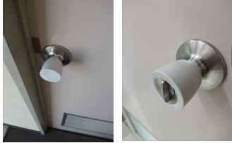
ドアノブの抗菌化

リモコン用シュリンク袋を、 カットして、袋側を鍵無しへ チューブ側を鍵付き側へ シュリンクしました、