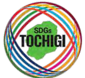
とちぎSDGs推進企業 登録マーク