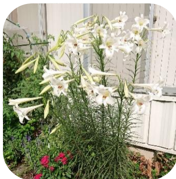
満開の高砂百合 真っ白の大きな花はとてもきれいです