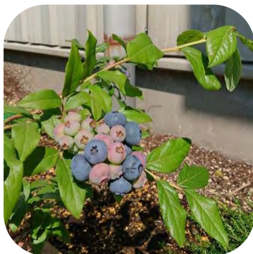
今年は花壇を拡張しブルーベリーを栽培。しっかり、実がつけました