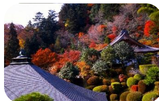
2018年JR東日本のCMに吉永小百合さんと登場したお寺です

八溝山地のふところ深く、清らかな溪流に沿う境地に、臨濟宗妙心寺派の名刹、雲巖寺があります。開山当時は、筑前の聖福寺、越前の永平寺、紀州の興国寺と並んで、禅宗の日本四大道場と呼ばれ、山門の正面にある朱塗りの反り橋を渡って石段を登ると、正面に釈迦堂、獅子王殿が一直線に並ぶ代表的な伽藍配置となっています。俳聖松尾芭蕉は、この地で「木啄も庵は破らず 夏木立」の句を残しています。春の新緑・秋の紅葉・冬の雪景色は見事です。