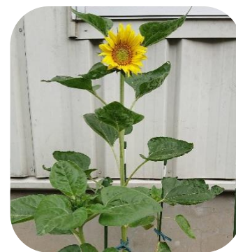
夏といえばひまわり！ 今年も立派に咲きました