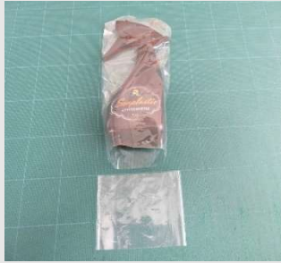
トリガーボトルに使用 (サイズ全周215mm×182mmH)