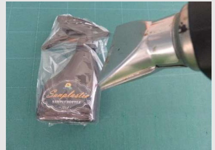
ヒータングガン にてシュリンク

こちらの規格品(B-5)は在庫しており、ロットも1,000枚から販売しておりますのでお急ぎの場合や小ロットの場合に便利なシュリンク袋となります。