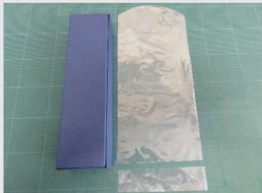
化粧箱でも対応可能 フィルムを3cm程カットして使用