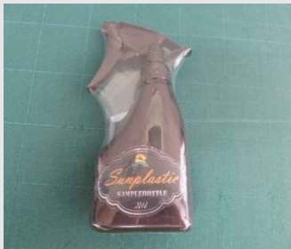
仕上がりはこんな感じです

こちらの規格品(B-5)は在庫しており、ロットも1,000枚から販売しておりますのでお急ぎの場合や小ロットの場合に便利なシュリンク袋となります。